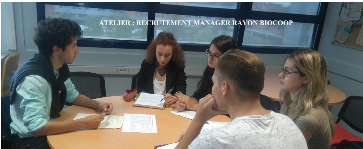
ATELIER : RECRUTEMENT MANAGER RAYON BIOCOOP