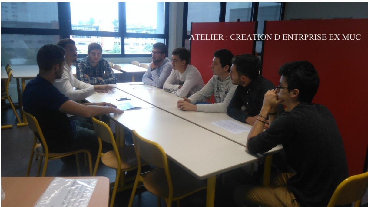
ATELIER : CREATION D ENTREPRISE EX MUC