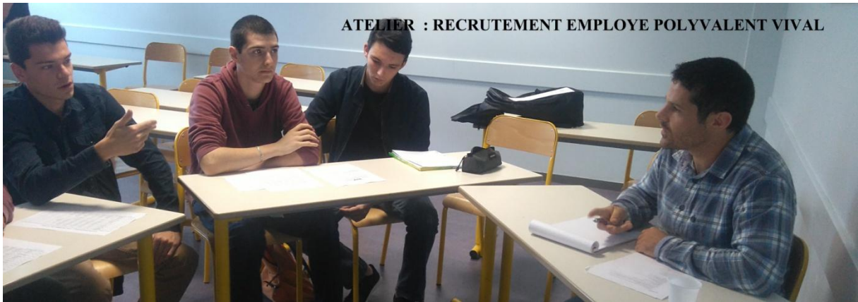
ATELIER : RECRUTEMENT EMPLOYE POLYVALENT VIVAL